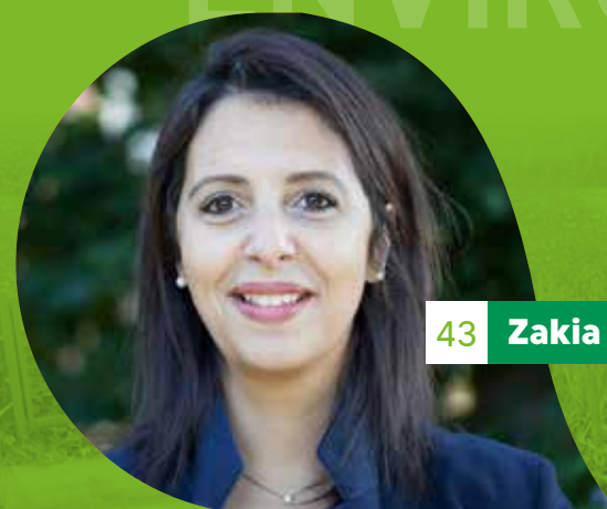
43 Zakia Khattabi